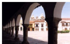
Cartagena, Plaza de la Aduana