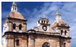
Cartagena, Kirche und Konvent San Pedro Claver